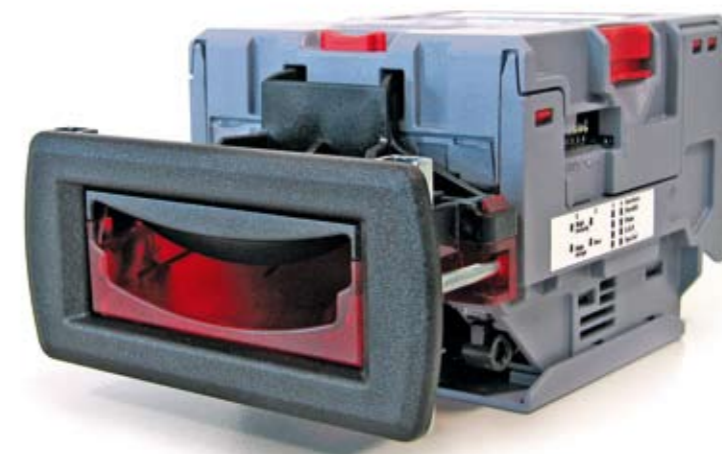
NV10: превосходство среди купюроприемников.

less payment systems using either keys or chip-cards, change machines, start washes, automatic cash points, special products for external use, anti-theft and remote control systems. Most of our productive work is absorbed by the vending market, carwashes and amusement. Every year there is an increase in the offer of innovative solutions especially for new markets and today Comestero Group has been acknowledged for the high profile of its products in the self payment sector also in industrial, tourist, sports and public areas.