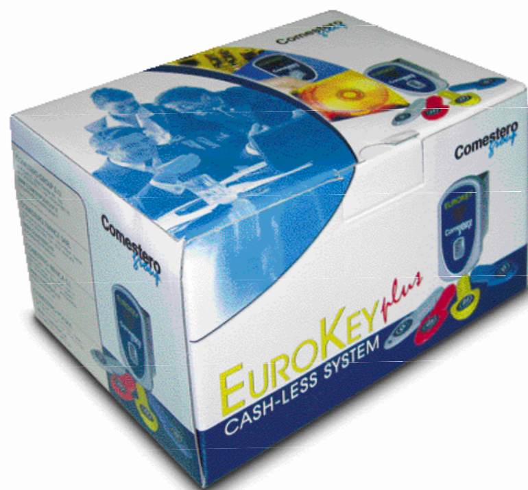
EuroKey Plus, безопасная и универсальная система безналичного расчета.